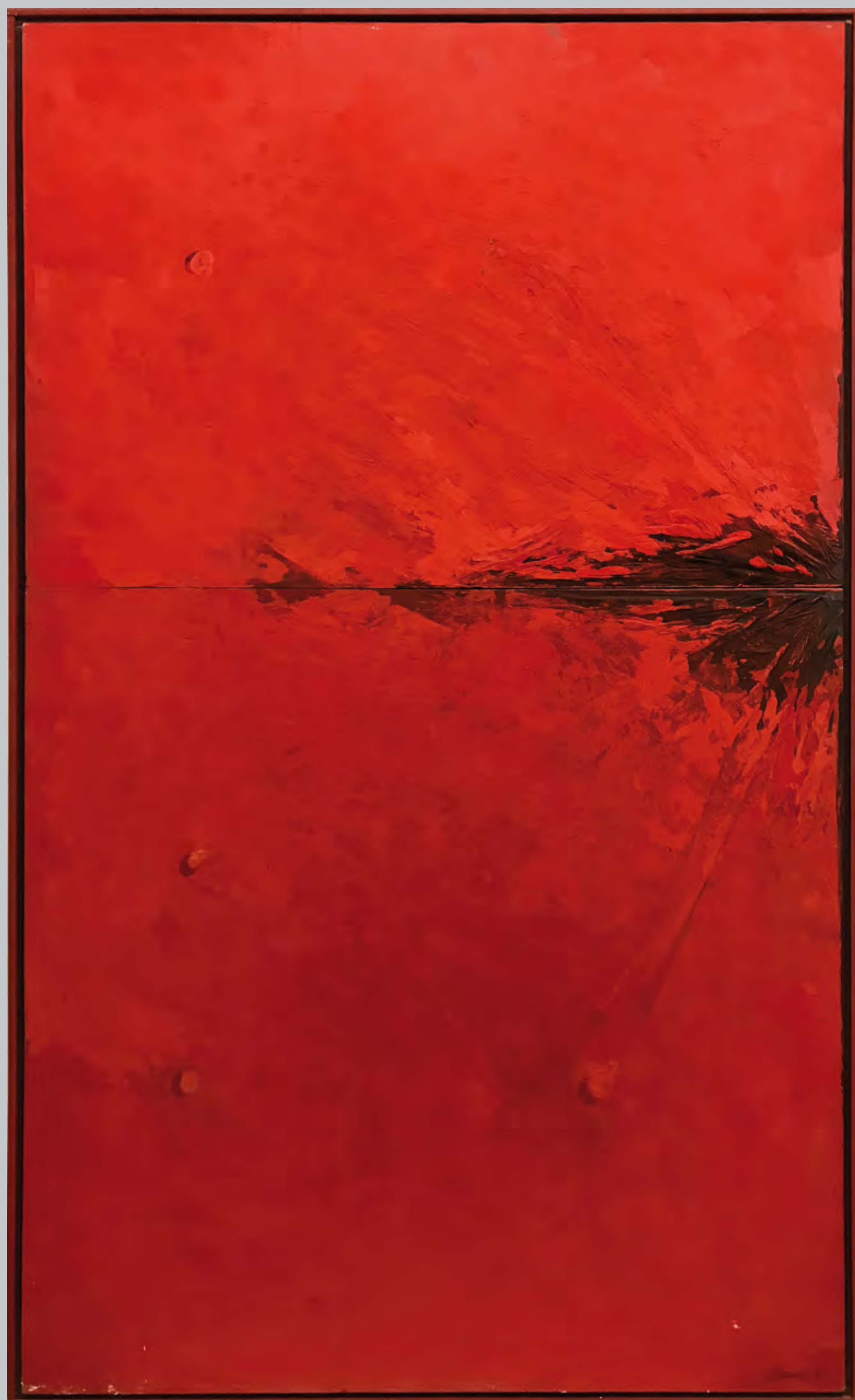
DALLA SERIE "STATIFICAZIONI" 1983, DI MARIO NANNI

Tra Memoria e Futuro, con le arti e con i cibi. Tre giorni, una unica lunga notte. La Notte Rossa dei Diritti, la festa delle Case del Popolo e dei Circoli Culturali.